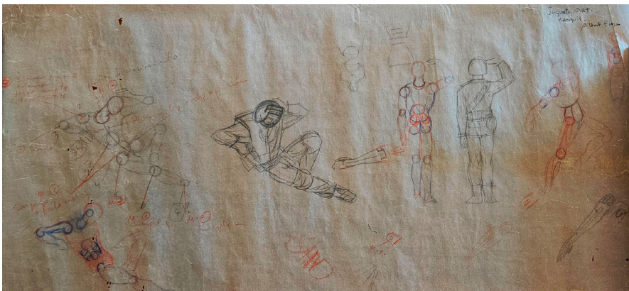
Plano original. Plano 2.

En el centro del plano se observa la evolución de una de las figuras del primero, concretamente la tumbada en el suelo, ya con ropa, y que claramente parece algún tipo de piloto, y, de espaldas, un claro dibujo de lo que sería el primer Madelman: un militar.